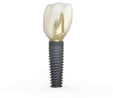
Abb. 2: Die bewährte EV mit One-position-only für Atlantis Abutments wurde speziell für digitale Arbeitsabläufe entwickelt.