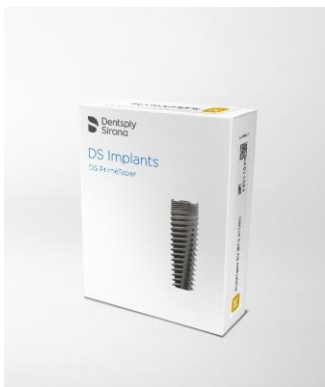
Abb. 1: Das DS PrimeTaper Implantatsystem